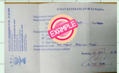
Contoh Surat Keterangan Sehat dan Status Buta warna disatukan