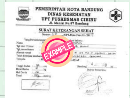
Contoh Surat Keterangan sehat saja